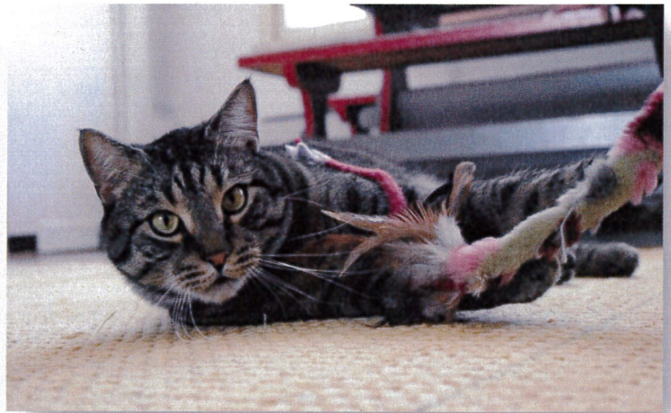
Kissatalon maskotti Eikka-kissa