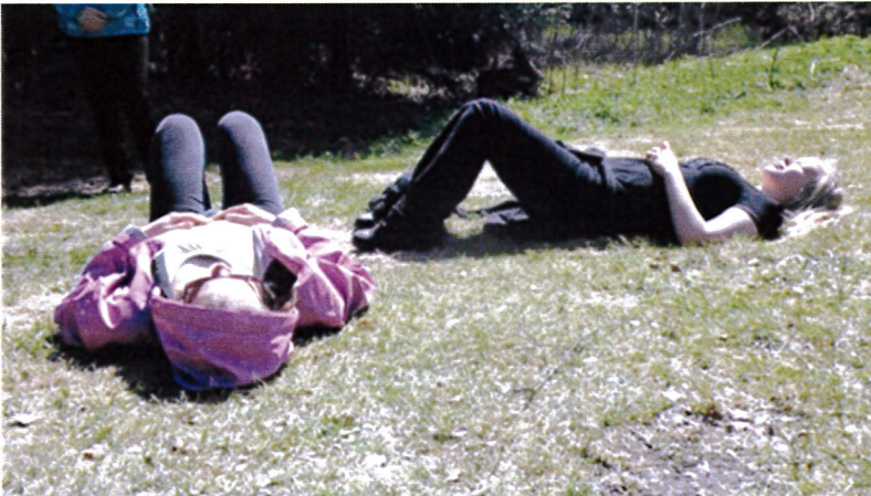
JA VÄLILLÄ ON HYVÄ LEPÄILLÄ