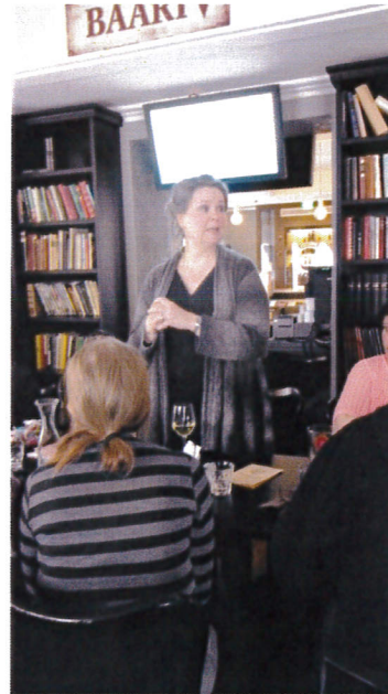
Läksiäis päivällinen ja puhe 2013