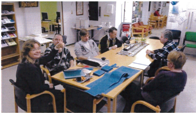
Avointen ovien suunnittelua 2012