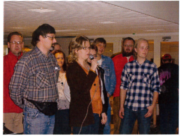
Ja tässä ollaan Porissa Kiset+ iltamat 2008