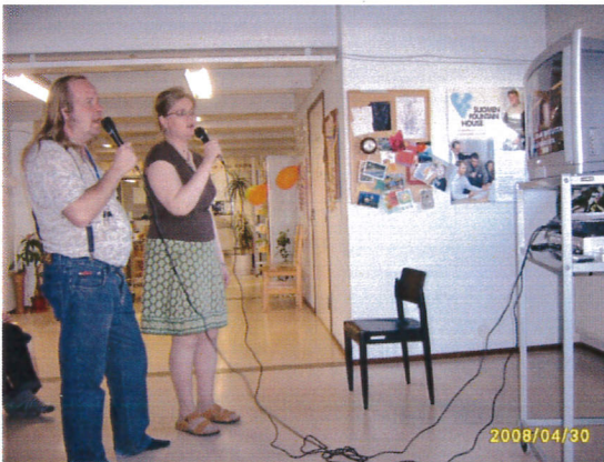
Karaokea laulamassa 2008