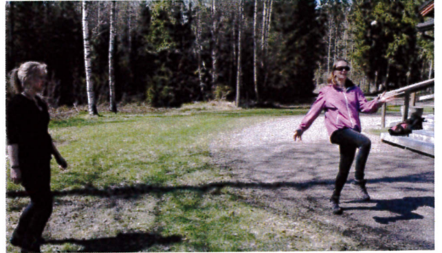
PIENTÄ TANSSAHTELUA, ILOISIN MIELIN.