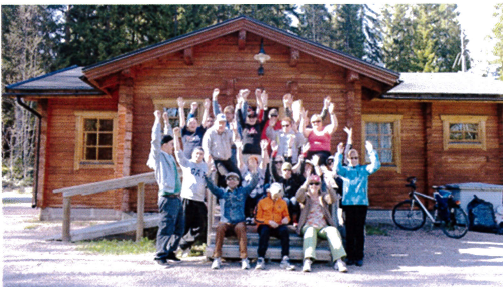
JA KUNNON LOPPU TUULETUS