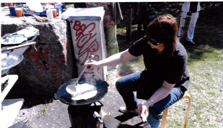
HERKULLISTEN LETUN PAISTOA.