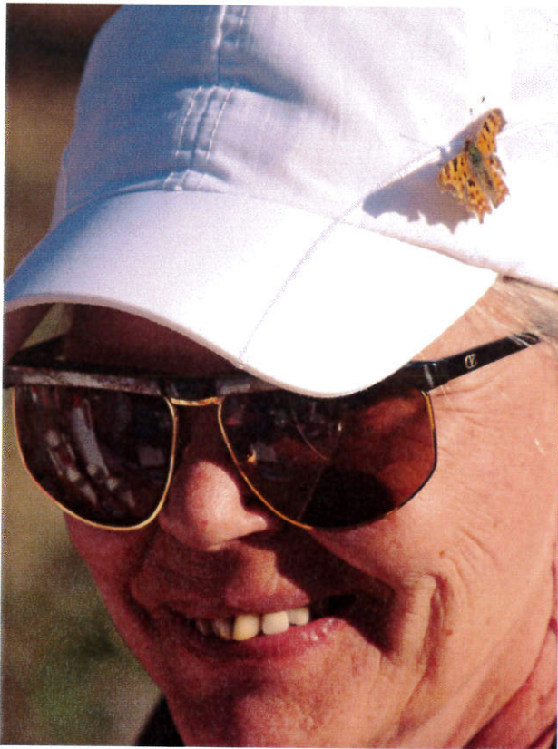
Perhonen paistatteli päivää hatulla Humlassa