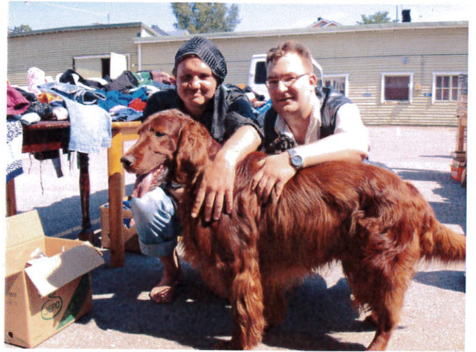
Koiranelämää ja pihukirpputoria