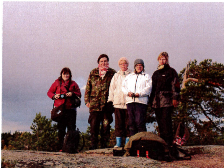
Luontoretellä syksyllä Partiopoukamassa