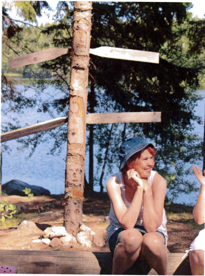
Intiaanikesänä on helppo hymyillä toteemin katveessa