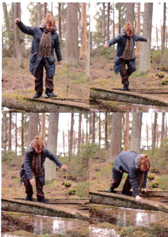
Taiteilua luonnon omilla pitkospuilla Venjärvellä