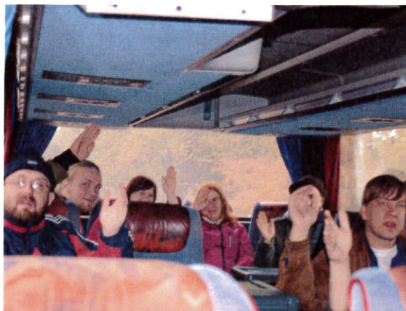
Linja-autossa on tunnelmaa (retki Karhulan klubille)