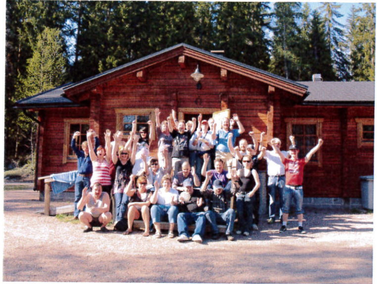
Kukan päivänä Humlan ulkoilumajalla