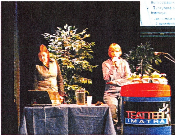
Elect-hankeesta ja Cimo:sta kertoivat Suvimäkeläiset