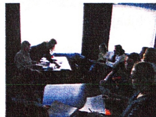
Työpaja työskentelyä Kurssit ja koulutukset ryhmässä