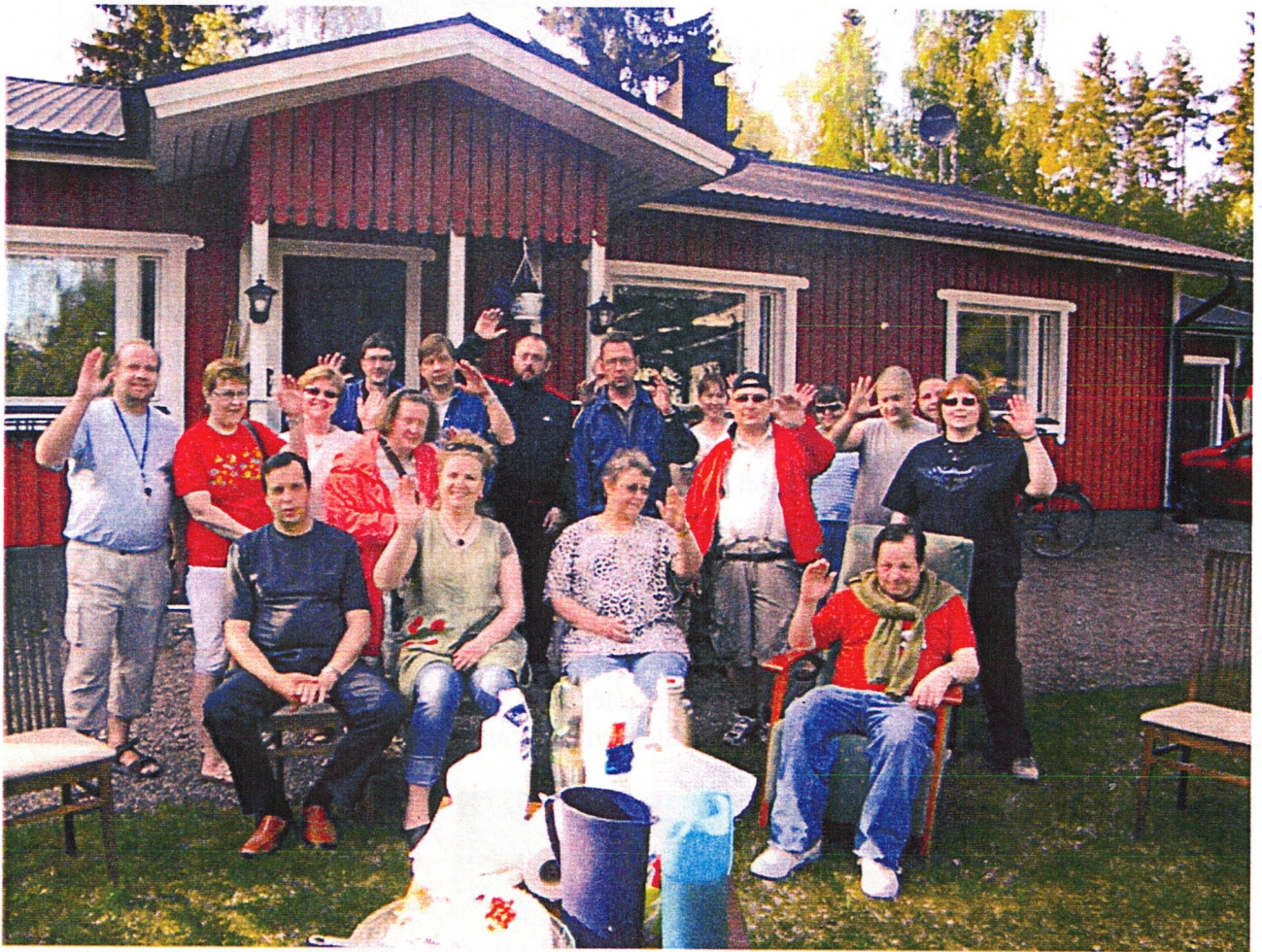
Ryhmäkuva Tuomaan tupaantulijaisista