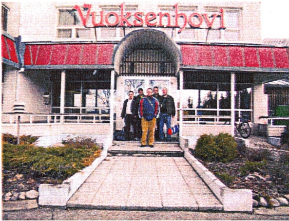
Saavuimme perille Hotelli Vuoksenhoviin