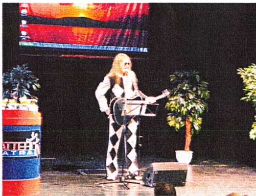
Musiikki esitys ja mainospuhe iltamista Bar Osmos&Cosmos