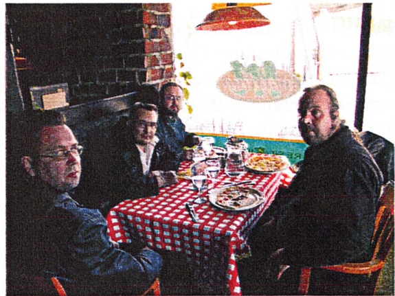
Päivällinen maistui Imatran keskustassa